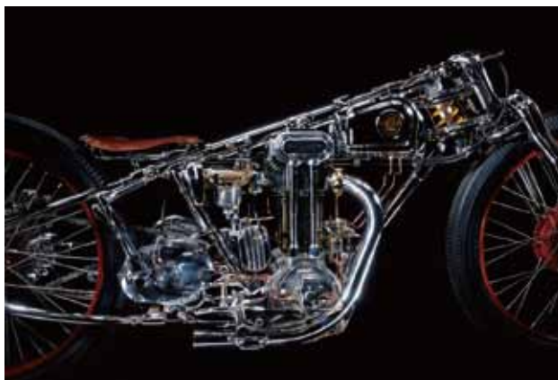
CHICARA NAGATA 《Chicara Art 3》2008 CHICARA NAGATA Chicara Art 3 2008 Courtesy of the artist Photo: Frank Kletschkus Germany