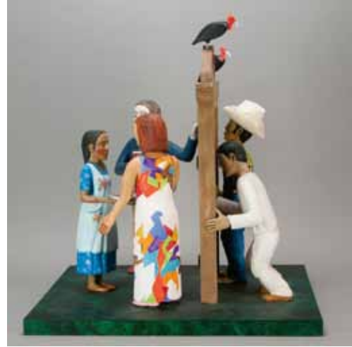
ルイス・タビア 《国境の祭》2008 サンタフェ・インターナショナル・フォークアート美術館蔵 Luis Tapia Fiesta at the Border 2008