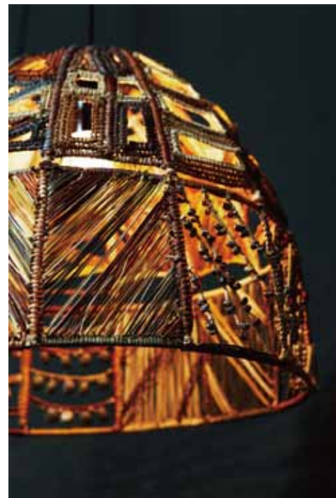
マーガレット・グドゥムクウィ/ユタ バダヤラ 《ペンダントライト》 Margaret Gudumurrkuwuy, Yuta Badayala Pendant Light