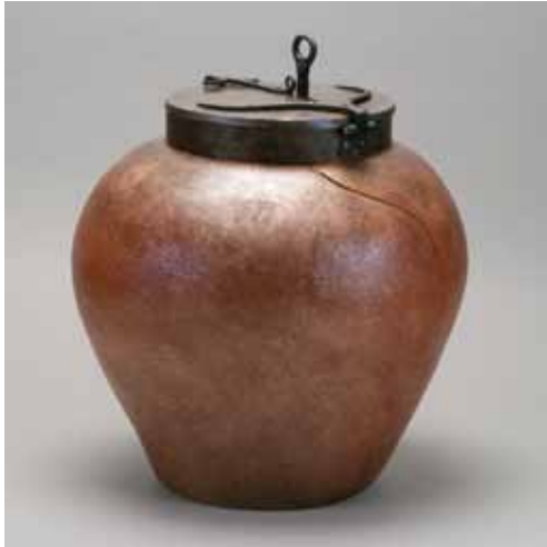
カミラ・トゥルヒーヨ と レネー・ザモーラ 《チョコレートポット》2012 サンタフェ・インターナショナル・フォークアート美術館蔵 Camilla Trujillo & René Zamora La Chocolatera 2012