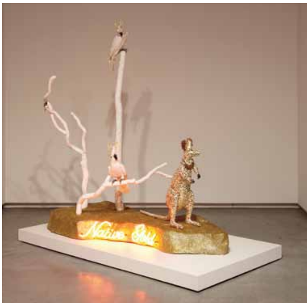
ダニー・メロール 《Native Gold》2008 シドニー現代美術館蔵 (Mordant Family の寄付金により 2008 年に購入) Danie Mellor Native Gold 2008 Museum of Contemporary Art Australia, purchased with funds donated by the Mordant Family, 2008