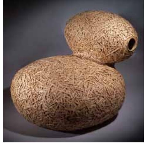
職人: 陳高明(ツン・カオミン) デザイナー: 王俊隆(ワン・チュンロン) 《Cocoon Plan - Sofa》2009 國立台灣工藝研究發展中心藏 Craft artist: CHEN Kao-Ming / Designer: Rock Wang Cocoon Plan - Sofa 2009 Collection of National Taiwan Craft Research and Development Institute