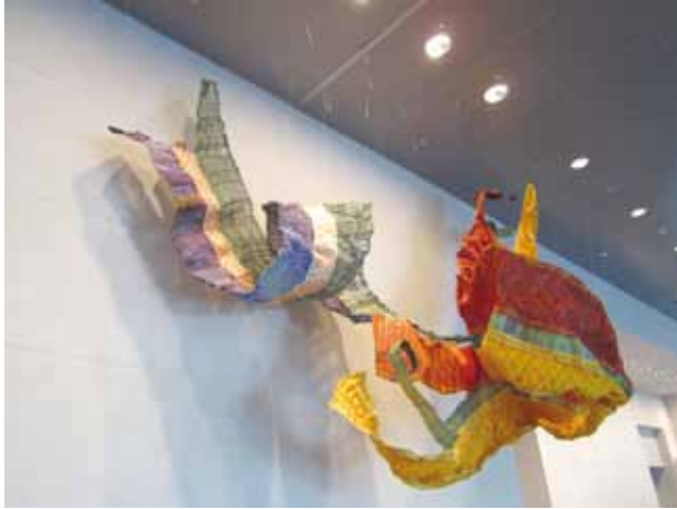
尤瑪 達陸 (ヨウマ・ダルウ) 《Convolution of Life Series》2012-13 Yuma Taru Convolution of Life Series 2012-13